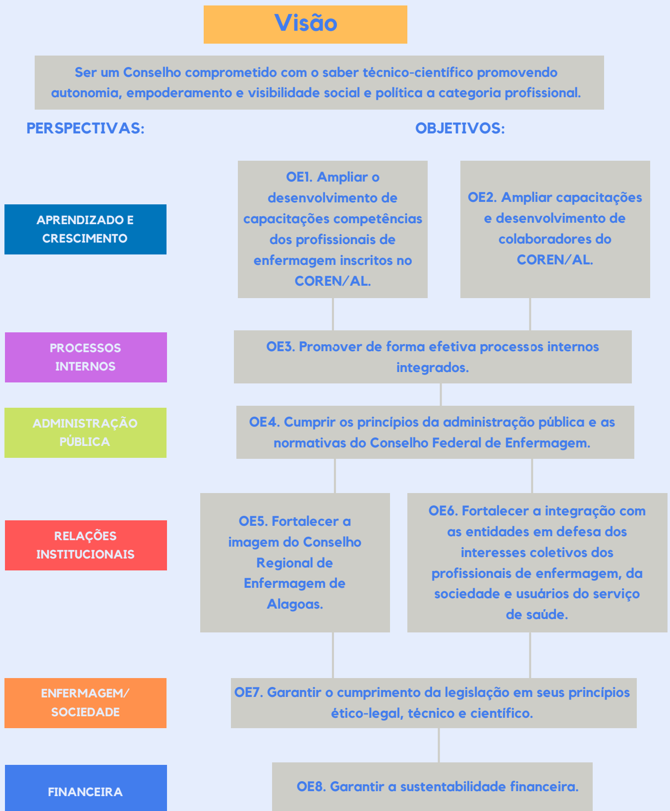
Figura 2 - Mapa Estratégico