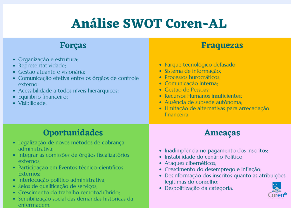
Figura 1 - Matriz swot

Para a construção do PE 2022-2024 foram realizadas reuniões com as áreas do Coren/AL e através de algumas ferramentas como chuva de ideias foram sintetizados o conjunto de informações do quadro abaixo de forma a direcionar a instituição nos seus objetivos estratégicos.