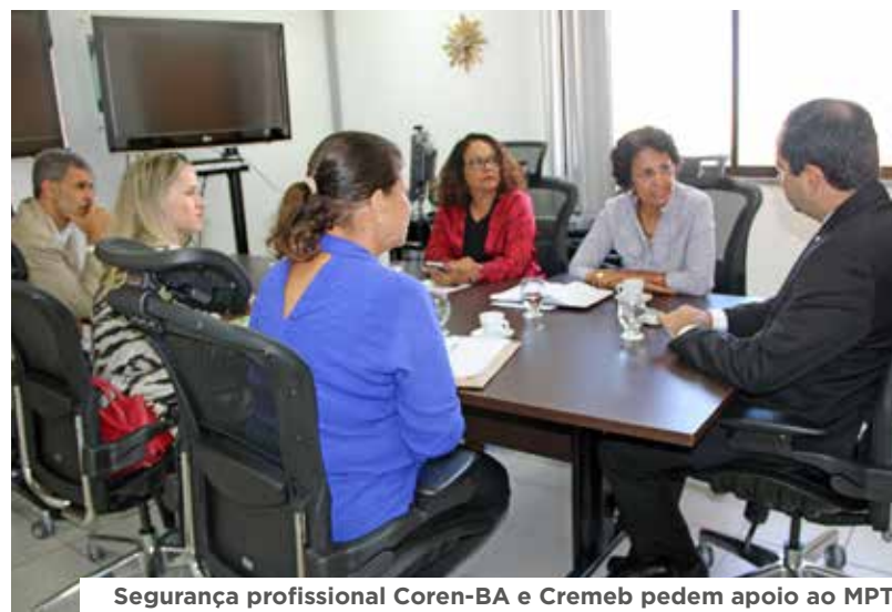
Segurança profissional Coren-BA e Cremeb pedem apoio ao MPT