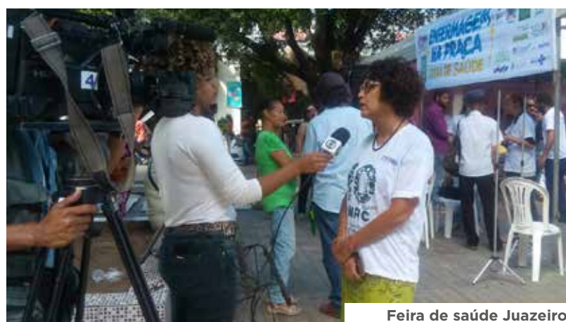
Feira de saúde Juazeiro