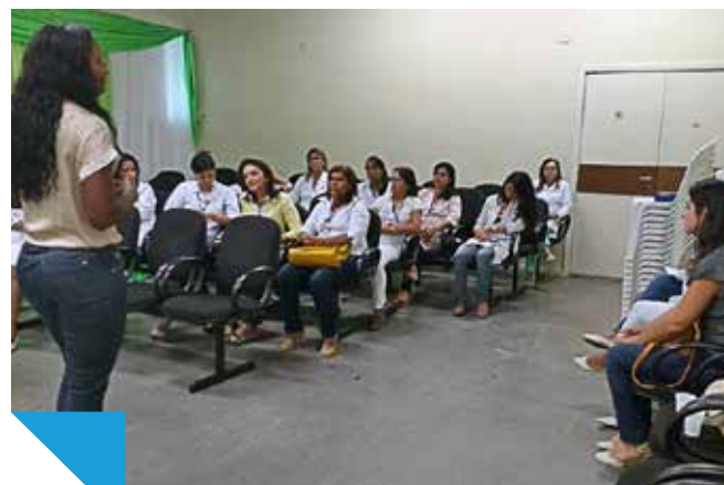
Palestra implantação CEEn Feira de Santana

Também em evento promovido durante a 77ª Semana Brasileira de Enfermagem, a subseção de Feira de Santana orientou a equipe de enfermagem do Hospital Geral Clériston Andrade (HGCA) para implantação da Comissão de Ética de Enfermagem (CEEn).