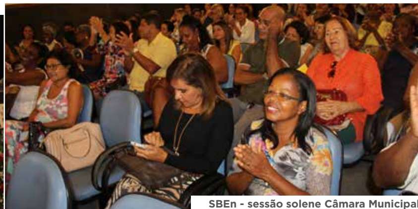
SBEEn - sessão solene Câmara Municipal