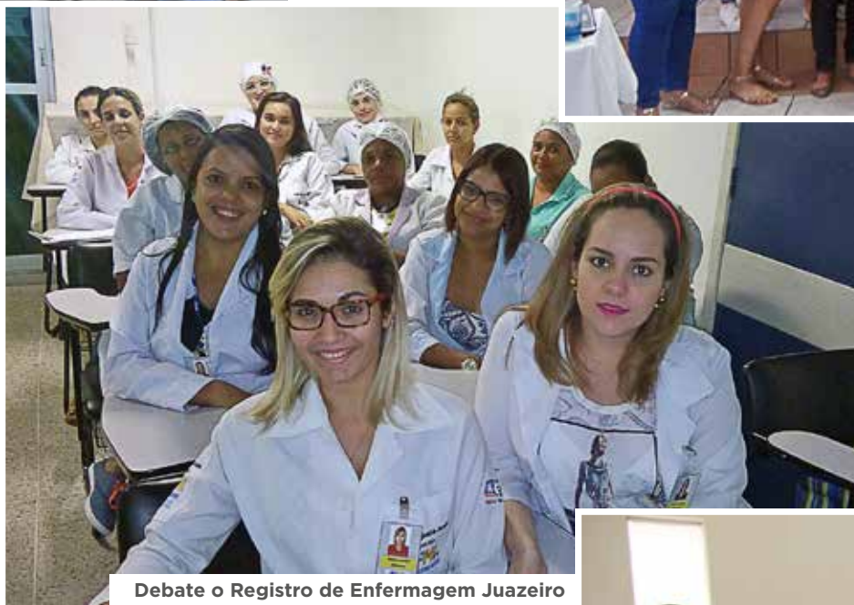
Debate o Registro de Enfermagem Juazeiro