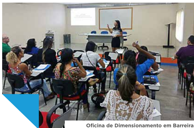
Oficina de Dimensionamento em Barreiras