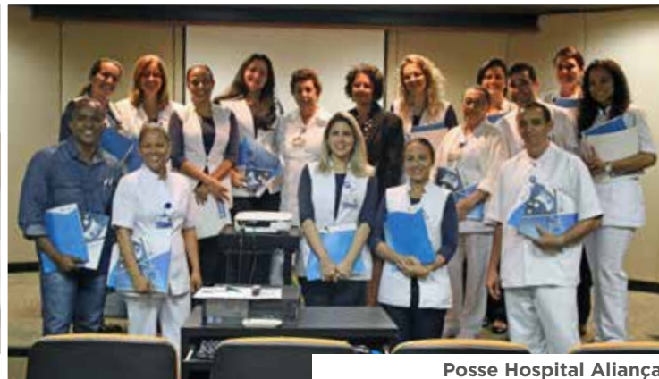
Posse Hospital Aliança