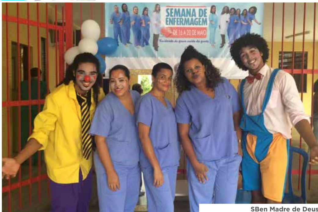
SBEEn Madre de Deus