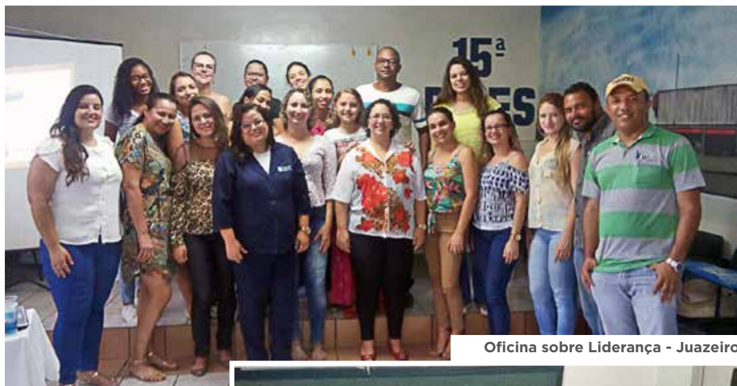
Oficina sobre Liderança - Juazeiro