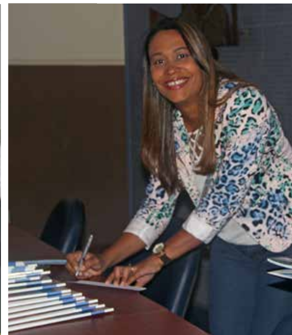
Posse Hospital Santo Antonio Irmã Dulce