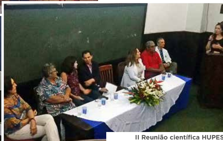
II Reunião científica HUPES