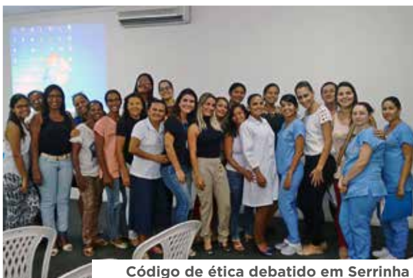
Código de ética debatido em Serrinha

Em dezembro, na sede do Coren-BA, aconteceu mais um encontro da comissão formada para discutir a reformulação do Código de Ética dos Profissionais de Enfermagem (CEPE). Diretrizes foram traçadas para ampliar as discussões sobre a reformulação, no intuito de envolver a comunidade de Enfermagem da capital e interior.