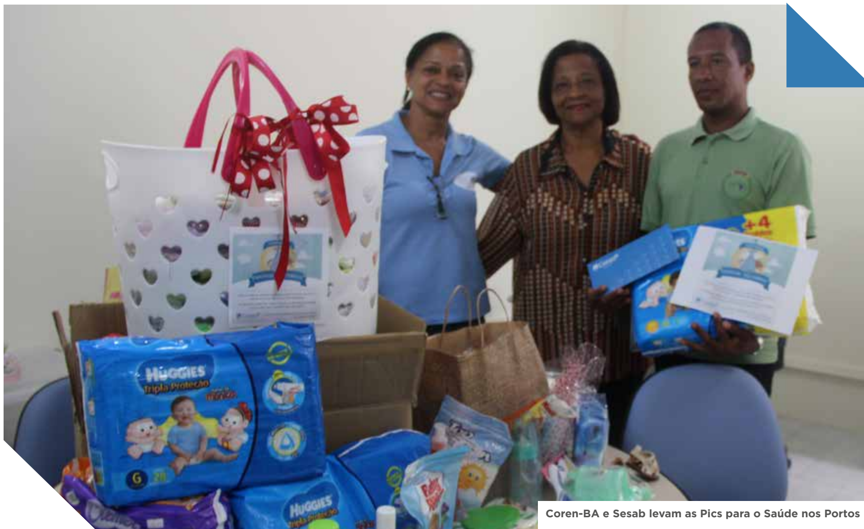
Coren-BA e Sesab levam as Pics para o Saúde nos Portos