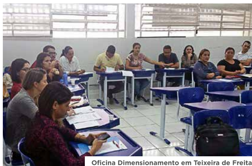
Oficina Dimensionamento em Teixeira de Freitas