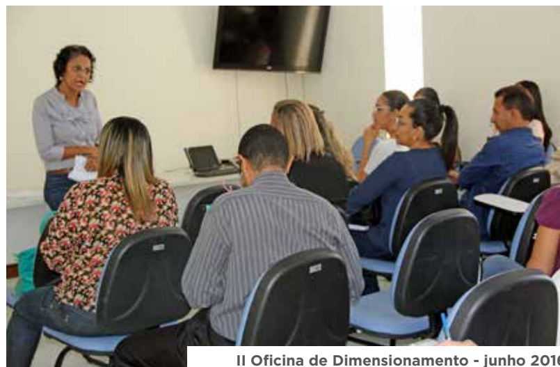
II Oficina de Dimensionamento - junho 2016

O trabalho foi realizado nos municípios de Salvador, Irecê, Feira de Santana, Barreiras, Juazeiro, Teixeira de Freitas e Paulo Afonso. O público alvo foi formado por gerentes de serviços de enfermagem e enfermeiras (os) da assistência. Em Salvador, professores e estudantes do 6º ao 9º semestres dos cursos de Enfermagem das faculdades Bahiana, Uneb e Católica também foram capacitados. No total, as oficinas atenderam um público de mais de 350 profissionais.