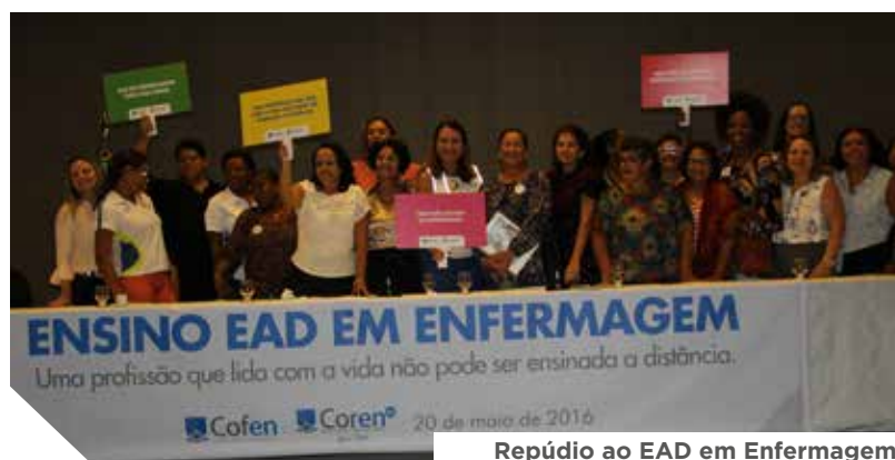
Repúdio ao EAD em Enfermagem