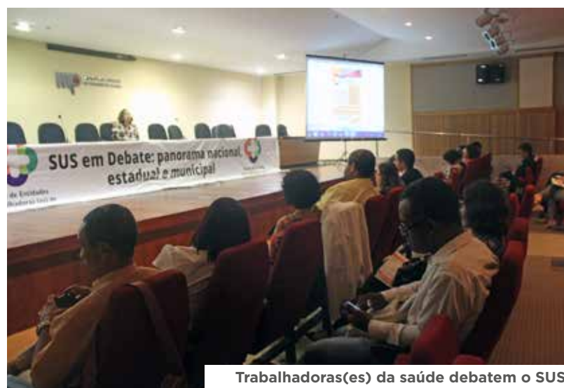
Trabalhadoras(es) da saúde debatem o SUS