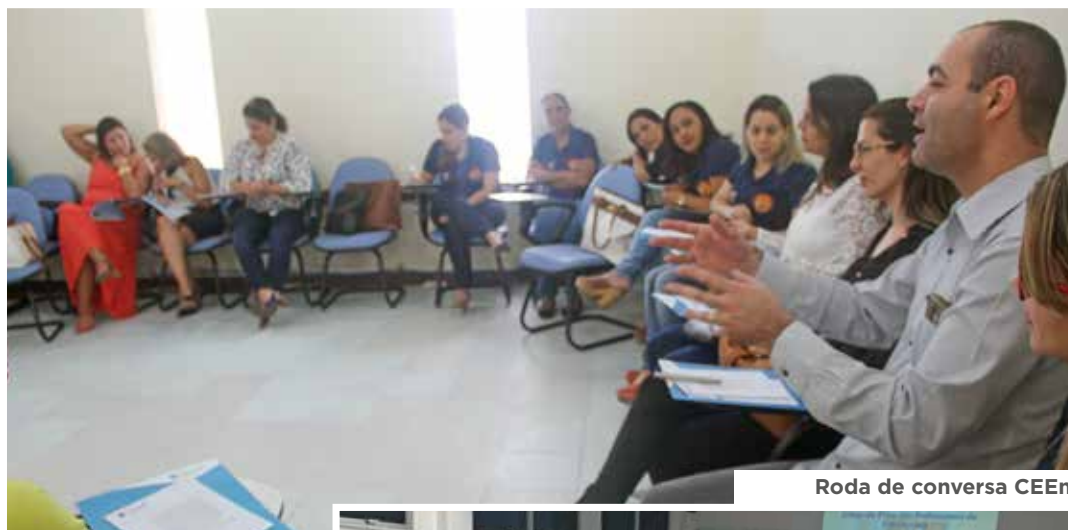
Roda de conversa CEEEn