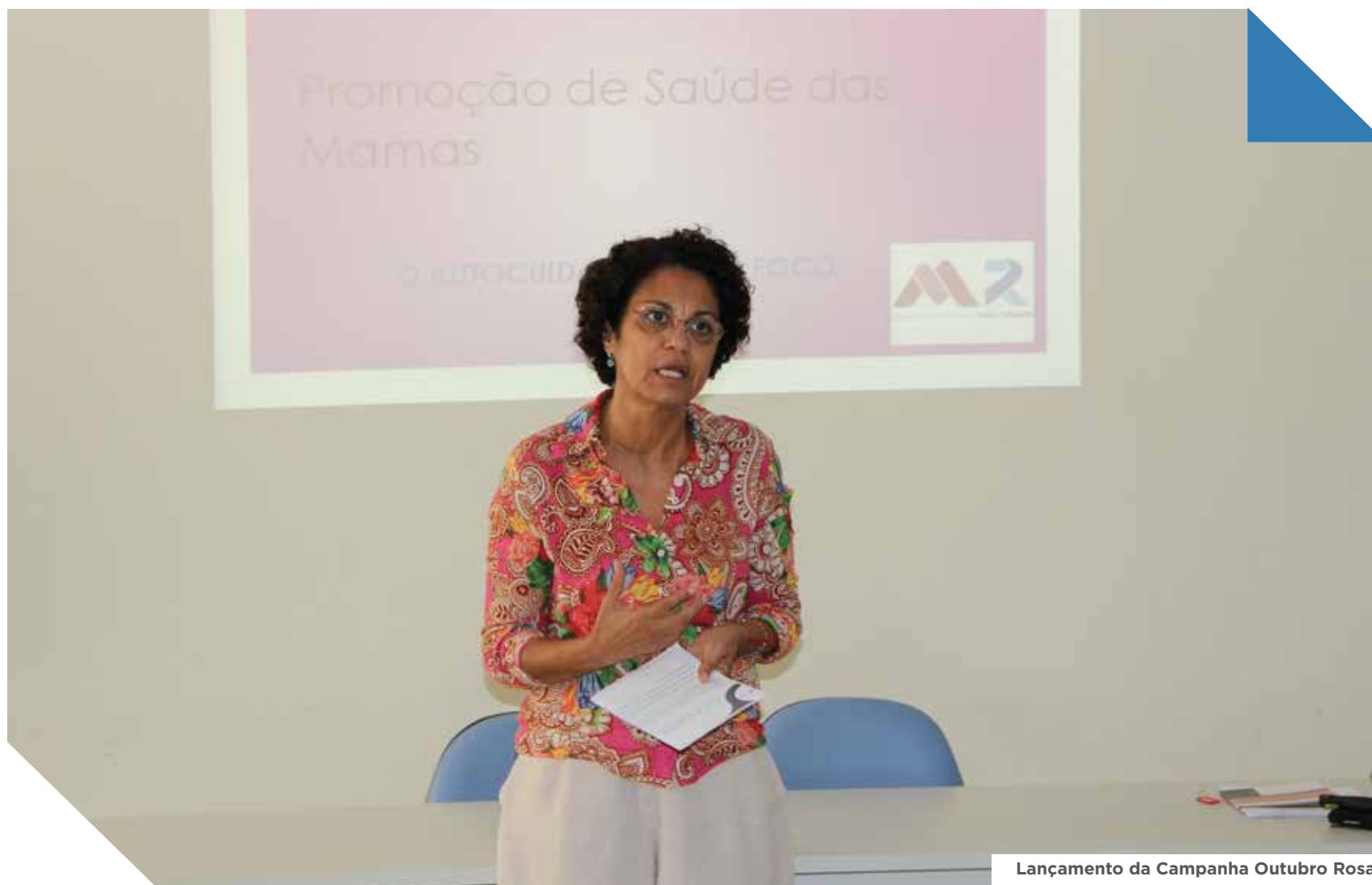
Lançamento da Campanha Outubro Rosa