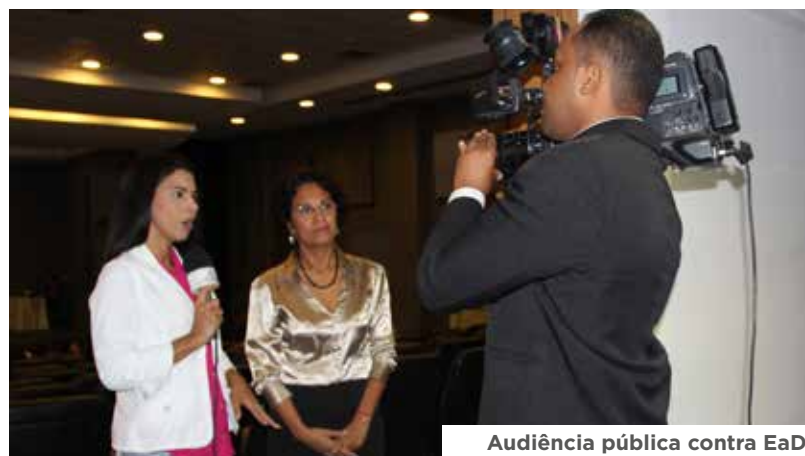
Audiência pública contra EaD

O programa Jornal da Manhã da Rede Globo e as afiliadas da emissora, TVs Santa Cruz e São Francisco noticiariam a realização da feira de saúde Enfermagem na Praça, realizada durante o mês de maio, em Salvador, Itabuna e Juazeiro respectivamente.