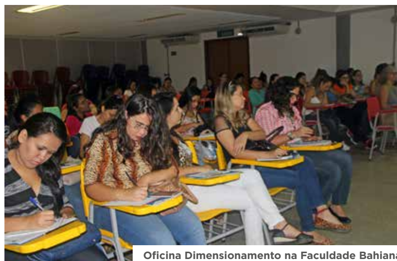
Oficina Dimensionamento na Faculdade Bahiana