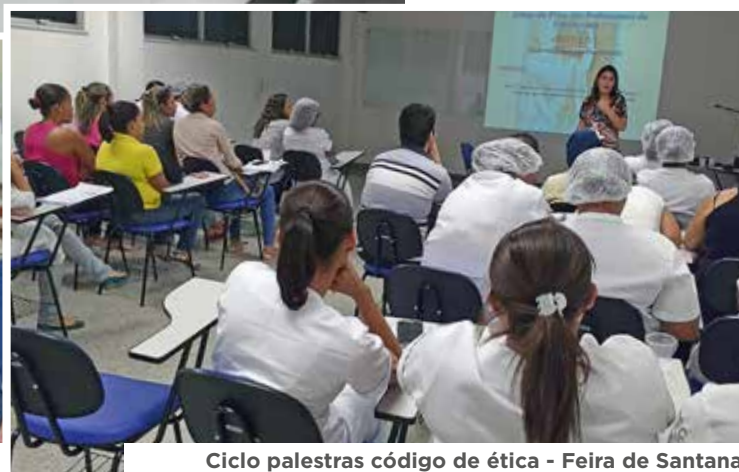
Ciclo palestras código de ética - Feira de Santana