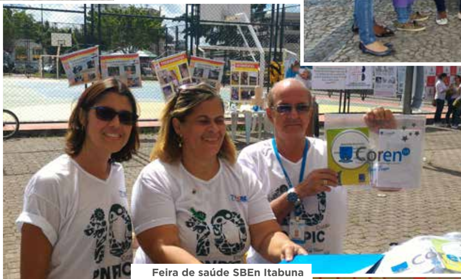
Feira de saúde SBEEn Itabuna