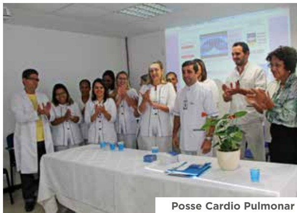
Posse Cardio Pulmonar