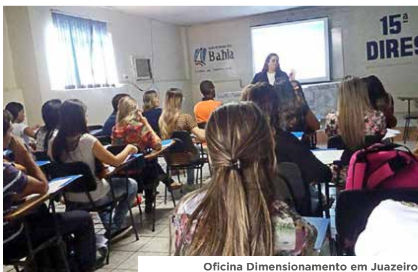
Oficina Dimensionamento em Juazeiro