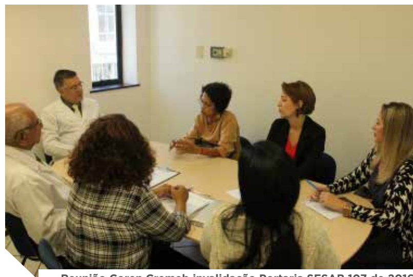
Reunião Coren Cremeb invalidação Portaria SESAB 107 de 2016