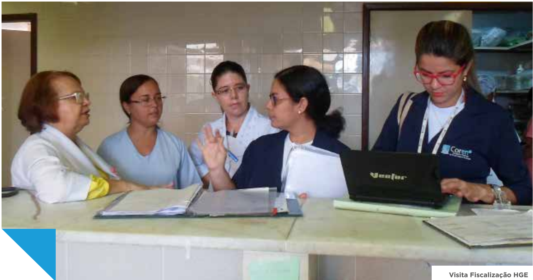
Visita Fiscalização HGE

Em dezembro, o Coren-BA, através da Câmara Técnica de Atenção à Saúde da Mulher (CTASM) e do Departamento de Fiscalização (Defis), realizou visitas a unidades de saúde da Secretaria Municipal de Saúde de Salvador (SMS). O objetivo foi aplicar novo instrumento de fiscalização nos serviços de atendimento à mulher.