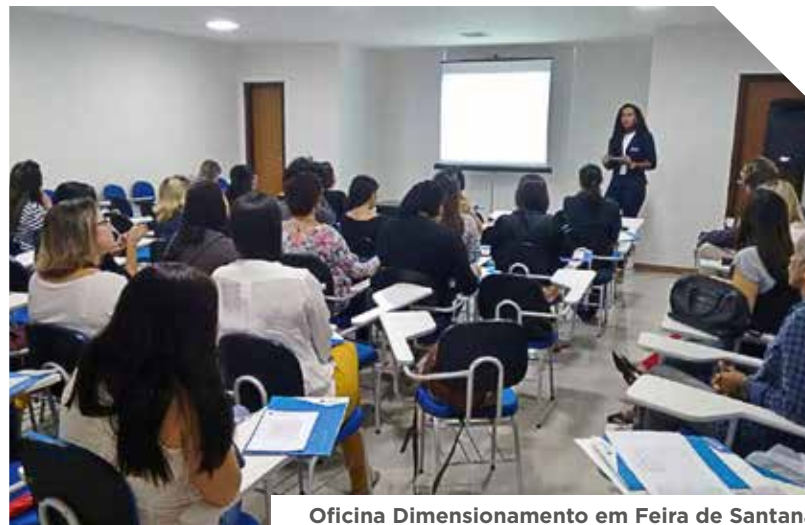
Oficina Dimensionamento em Feira de Santana