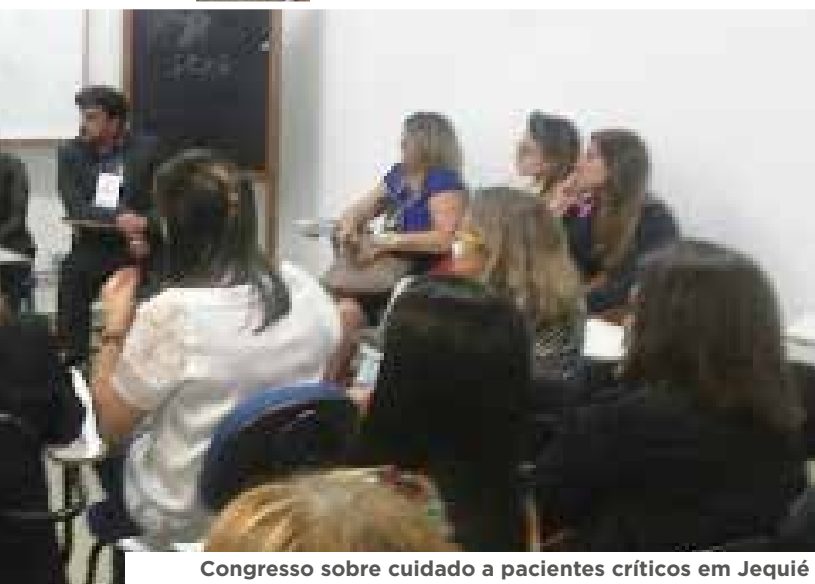
Congresso sobre cuidado a pacientes críticos em Jequié