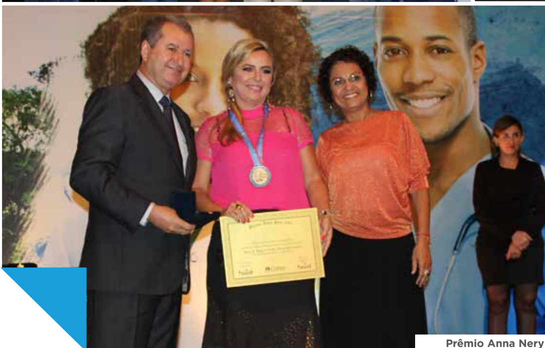
Prêmio Anna Nery