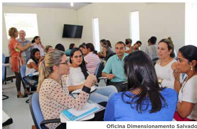
Oficina Dimensionamento Salvador