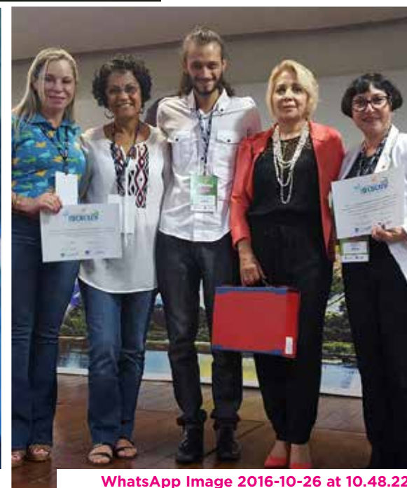
WhatsApp Image 2016-10-26 at 10.48.22