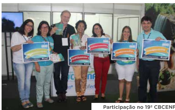
Participação no 19º CBCENF