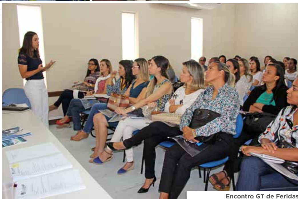
Encontro GT de Feridas