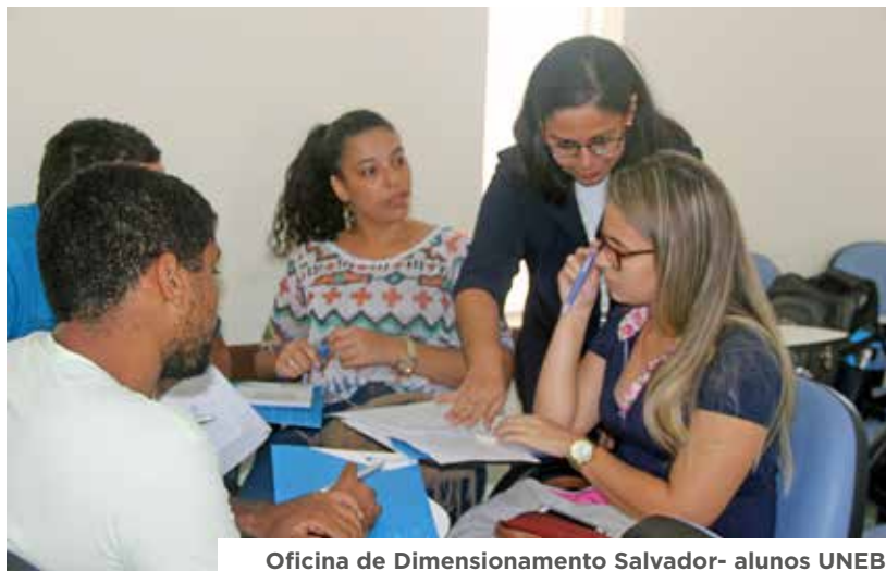
Oficina de Dimensionamento Salvador- alunos UNEB