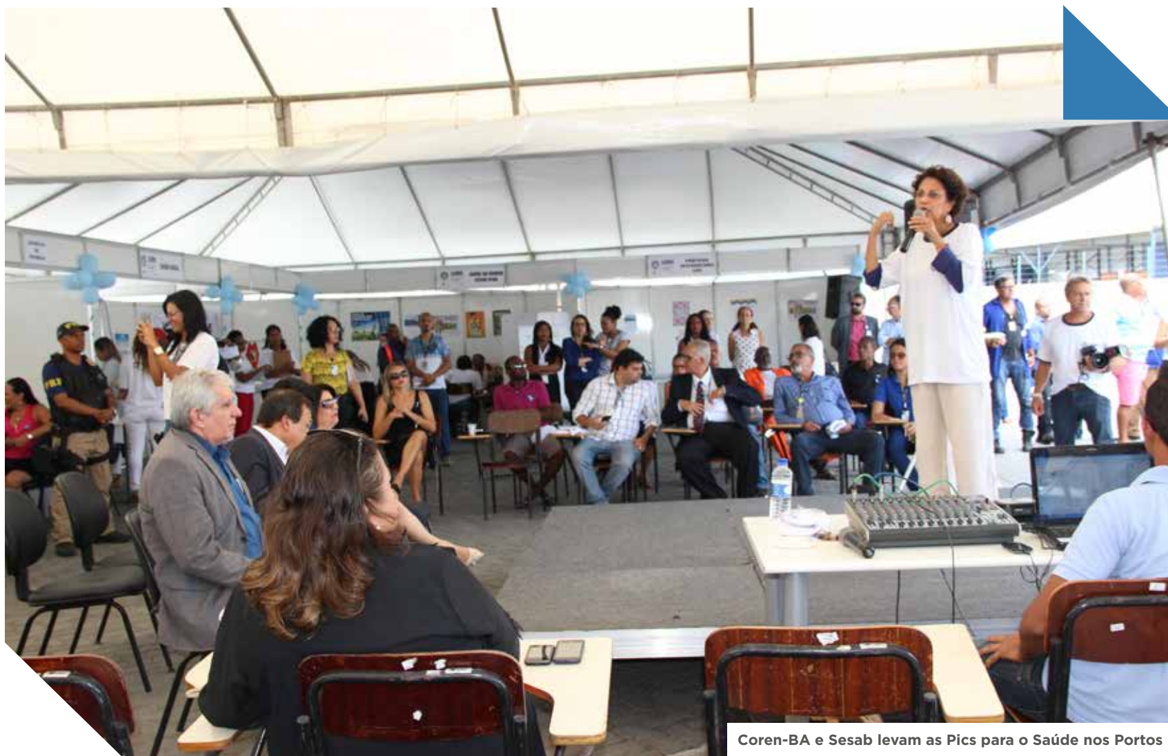
Coren-BA e Sesab levam as Pics para o Saúde nos Portos