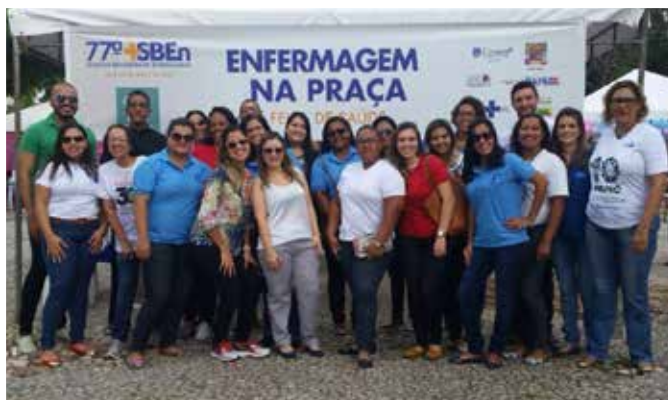
Feira de Saúde SBEEn Alagoínhas