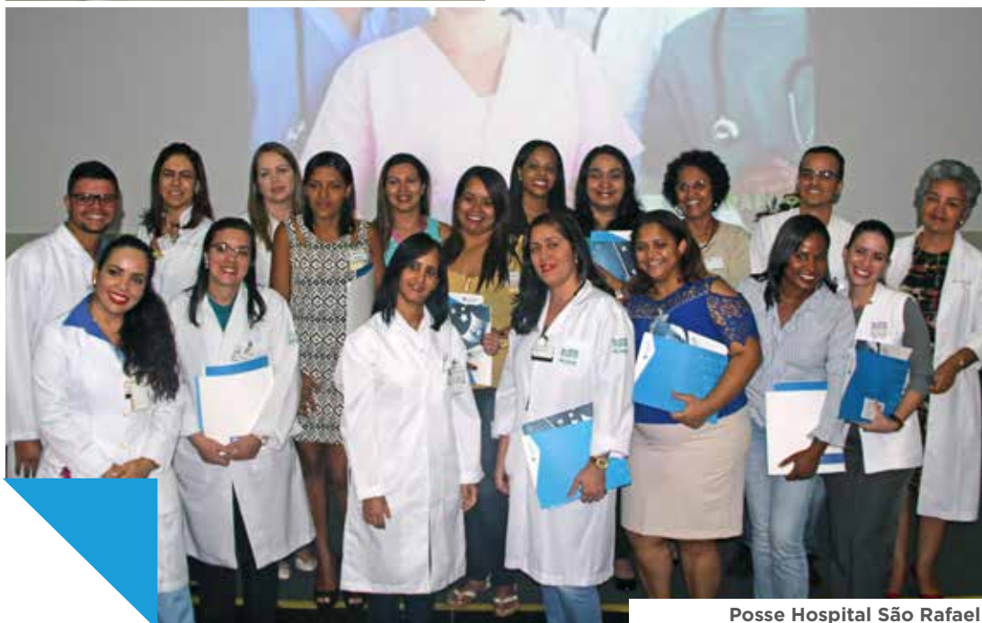
Posse Hospital São Rafael