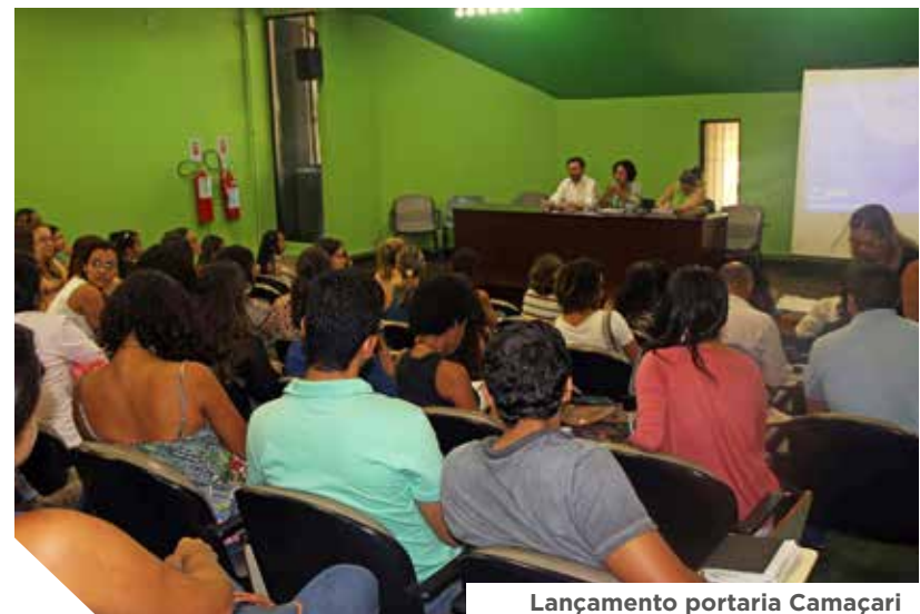
Lançamento portaria Camaçari