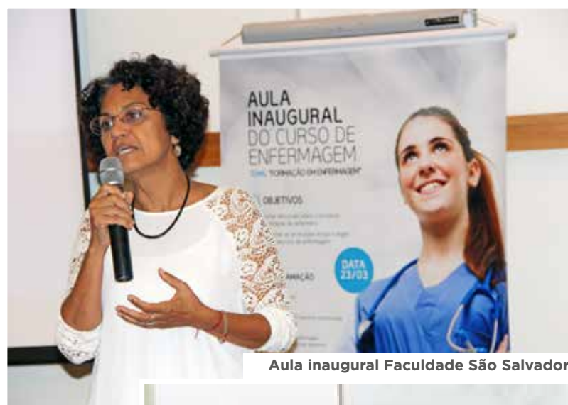
Aula inaugural Faculdade São Salvador

técnicos (os) de enfermagem e enfermeiras (os), o método científico e o pensamento crítico na enfermagem, as etapas do processo de enfermagem, sistemas de classificação em enfermagem, entre outras orientações que vão subsidiar a implantação/implementação da SAE nas unidades de saúde.