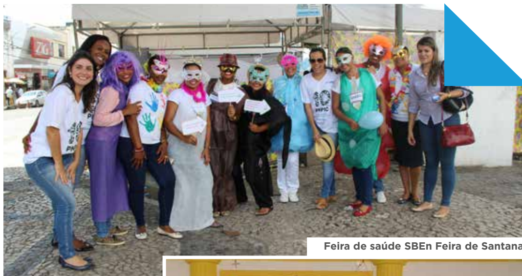
Feira de saúde SBEEn Feira de Santana