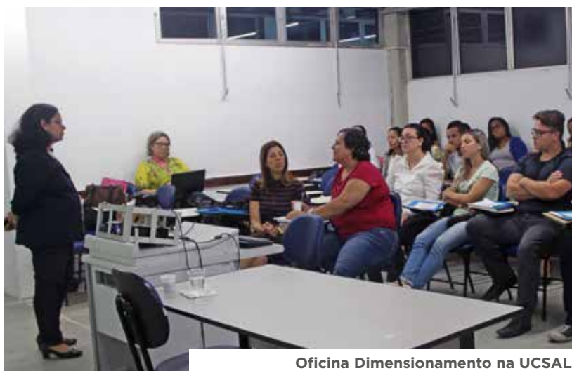
Oficina Dimensionamento na UCSAL