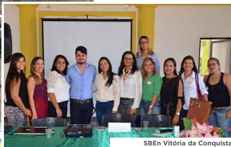
SBEEn Vitória da Conquista