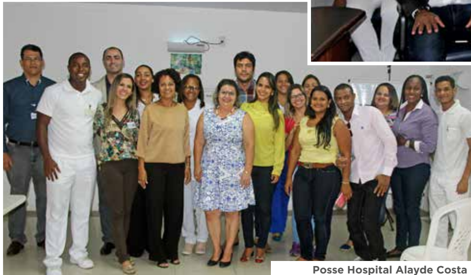
Posse Hospital Alayde Costa