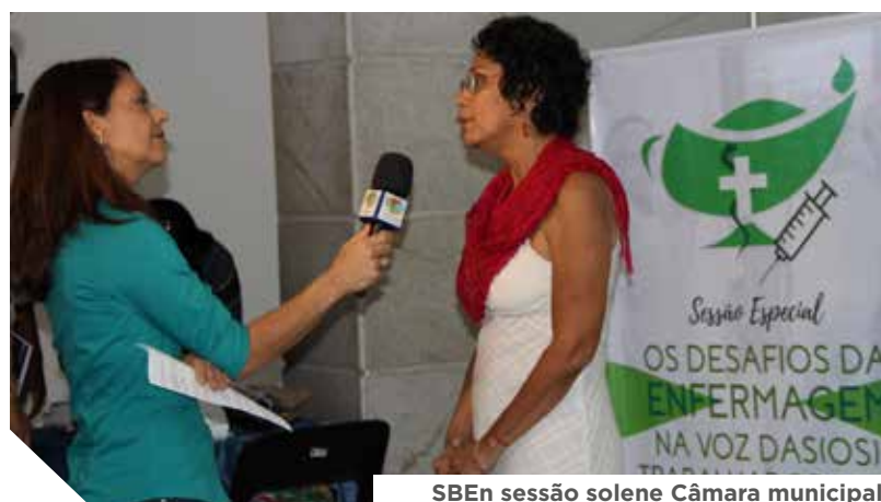
SBE n sessão solene Câmara municipal