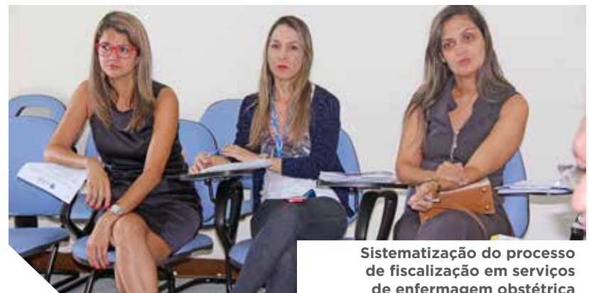
Sistematização do processo de fiscalização em serviços de enfermagem obstétrica