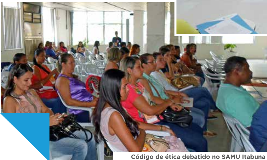
Código de ética debatido no SAMU Itabuna