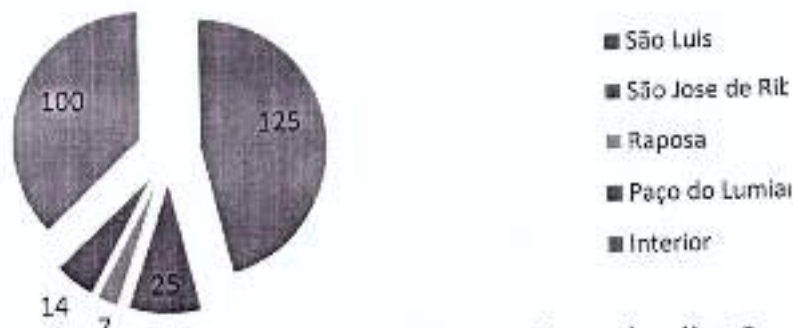
Gráfico 02: Instituições inspecionadas no ano de 2015, segundo sua localização.

Os seguintes interiores foram visitados: Axixá; Anapurus; Bacabeira; Bacuri; Barra do Corda; Barreirinhas; Barão de Grajaú; Bequimão; Balsas; Caxias; Chapadinha Codó; Colinas; Cururupu; Grajaú; Humberto de Campos; Icatu; Itapecuru Mirim; Imperatriz, Mata Roma; Mirinzal; Morros; Paraibano; Palmeirândia; Peri Mirim; Presidente Vargas; Presidente Dutra; Presidente Juscelino; Pinheiro; Rosário; Santa Helena; Santa Rita; São Bento; Timon; Turiaçu; e Vargem Grande.