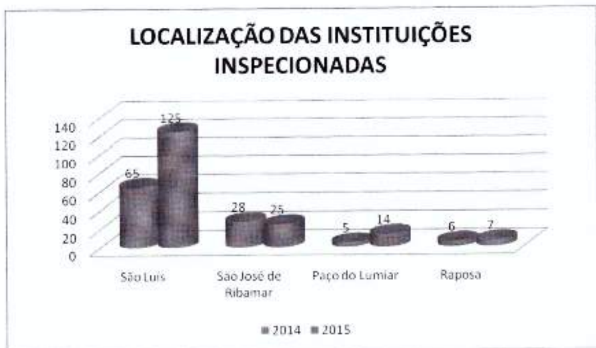
Gráfico 04: Instituições inspecionadas no ano de 2014-2015, segundo sua localização.

No ano de 2014, tendo como base o "Relatório das atividades da Unidade de Fiscalização do Coren-MA no ano de 2014", foram realizadas 98 fiscalizações, enquanto, no ano de 2015, ocorreu 325, o que representou um aumento de 30%. O gráfico abaixo revela uma evolução na cobertura da região metropolitana entre os anos de 2014 e 2015, especialmente na capital maranhense.