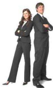
BLAZER MASCULINO Azul Marinho Bordado Brasão