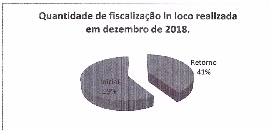
Gráfico 1. Quantidade de fiscalização in loco realizada em dezembro de 2018.

O gráfico 1 demonstra o quantitativo de 22 inspeções ocorridas em dezembro de 2018 pelo departamento, sendo 13 de fiscalização inicial e 09 de retorno, atingindo um total de 505 profissionais de enfermagem.