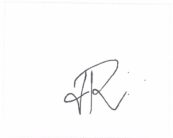
Assinatura de Rayra M.S Bserra de Araújo

Pontos de autenticação: Assinatura na tela IP: 177.51.7.169 Dispositivo: Mozilla/5.0 (iPhone; CPU iPhone OS 17_2_1 like Mac OS X) AppleWebKit/605.1.15 (KHTML, like Gecko) Version/17.2 Mobile/15E148 Safari/604.1 Data e hora: Fevereiro 08, 2024, 12:08:37 E-mail: beserrarayra@gmail.com Telefone: + 5583998103807 ZapSign Token: bd3797d4-****-****-****-7c50de032a9a External ID: 24594