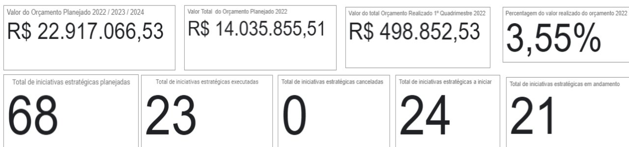
Status de cumprimento das Iniciativas Estratégicas - Plano Plurianual 2022 - 2024 - 2º Quadrimestre 2022

Conforme compilação feita pela Assessoria de Gestão e Governança Corporativa, apresentada por meio de painel visual (dashboard), são esses os resultados das ações até o término do 2º quadrimestre deste 2022: