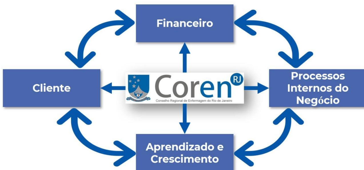
Imagem 3 – Balanced Scorecard (BSC)

Sendo todos eles interligadas através de uma relação de causa e efeito. Além disso, o BSC também promove o alinhamento dos objetivos estratégicos com indicadores de desempenho, metas e planos de ação. Desta maneira, é possível gerenciar a estratégia de forma integrada e garantir que os esforços da organização estejam direcionados para ações de impacto no negócio, que proporcionarão o alcance dos resultados esperados, seguindo a estrutura a seguir.